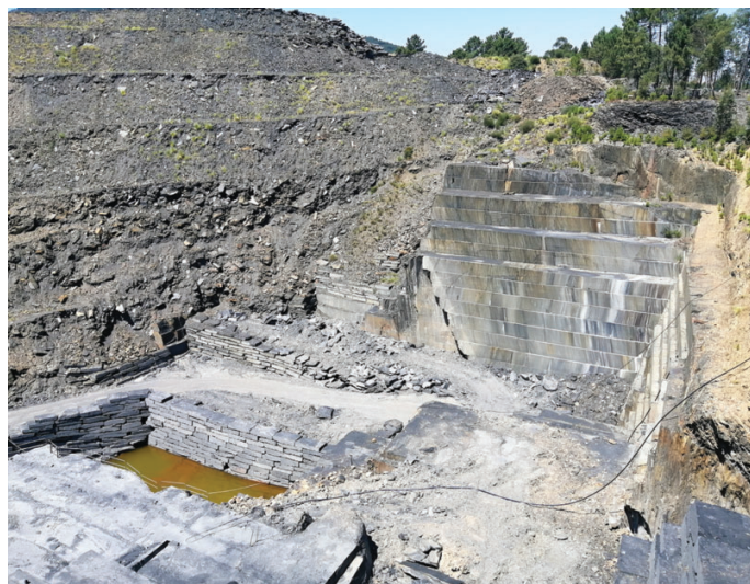
Kameňolom s haldou a narezanými blokmi bridlice vo Valongu.

ká bridlica, pod označením portská alebo valonská bridlica. Z nej sa v dielnach vyrába strešná krytina, dlažba, obklady, parapety, kuchynské a kúpeľňové dosky, bridlicové platne pre biliardové stoly, ale aj bridlicový dekoratívny štrk. Ročne spoločnosť spracuje vyše 200 000 m 2 bridlice. Až 90 % produkcie ide na vývoz. Hlavnými odberateľmi sú Austrália, Spojené kráľovstvo, Dánsko, Francúzsko, Japonsko, Nemecko, Španielsko a USA. Tovar sa balí do drevených paliet, aby mohol byť bezpečne prepravovaný po mori.