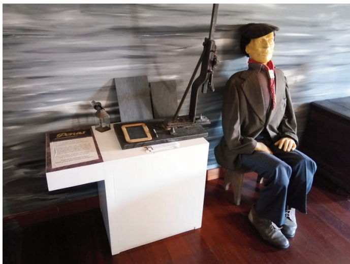
Straj na výrobe griflíkov v Múzeu bridlice v Campo-Valongo.

né palety. Interiér je prepojený spoločnou chodbou s informačnými tabuľami o vzniku bridlice, o Rimanoch, ktorí bridlicu používali na schody, obklady, strešnú krytinu, či rôzne závažia a o výrobkoch z bridlice. Z tých menej bežných sú to laboratórne stoly, náhrobné kamene, pomníky, čelá na krby, či stoly pre trhoviská. Plochá bridlica sa používala aj ako záťaž do lodí prepravujúcich víno z Porta do Anglicka.