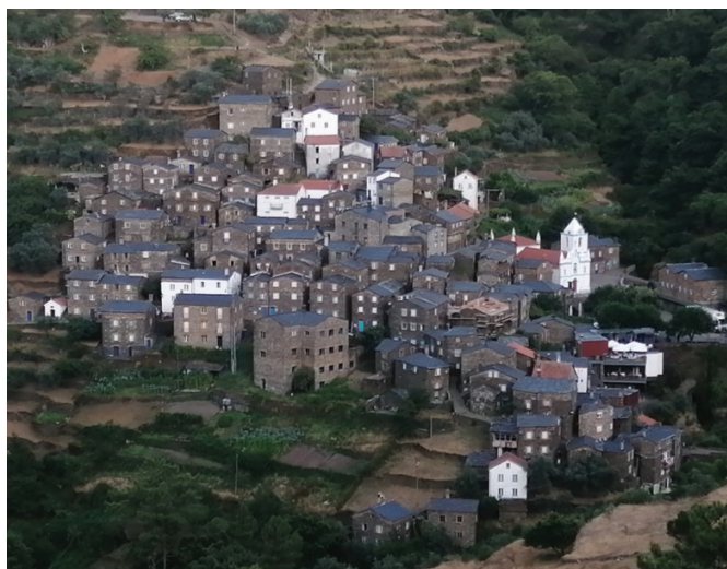
Celkový pohľad na domy unikátnej bridlicovej dedinky Piódão.

Malebná dedina Piódão pri obci Arganil je postavená v strmom svahu pohoria Serra do Açor s desiatkami domov, ale nie hocjakých. Všetky sú postavené z blokov modrosivej portugalskej bridlice a strechy majú pokryté veľkými platňami bridlice prevažne spôsobom tzv. divokého krytia. Cesty a chodníky sú taktiež z bridlice. V takejto „černote“ sa na domoch pekne vynímajú sýtomodré okná a dvere, ktoré dotvárajú dedine jedinečný špecifický vzhľad. V spodnej časti dediny Piódão sa vyníma svojou bielou farbou s modrými pásmi a lemovaním farský kostol Nossa Senhora da Conceição, patróna Piódãoa zo 17. storočia. Druhou významnou stavbou so zvonom zaveseným v zvláštne tvarovanej malej bridlicovej zvonici je Capela de São Pedro (Kaplnka sv. Petra). Uvádza sa, že cestu do Piódãoa posta-