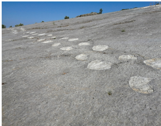
Stopy jurských dinosaurov vo vápenci pri Ourém-Torres Novas.

Ďalšou lokalitou, ktorú sme navštívili, bola prírodná pamiatka Dinosaurie stopy v Ourém-Torres Novas v prírodnom parku Serras de Aire e Candeeiros. Prehliadka sa začína v kinosále krátkym fil-